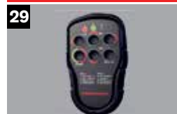
29 Draadloze bediening