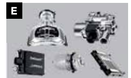
E Wabco remsysteem