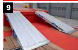
9 Gooseneck laadklep