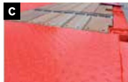
C S700 stalen chassis