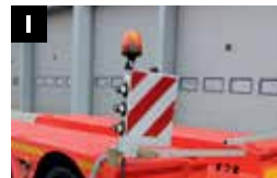
I Uitbreiding waarschuwingsplaten