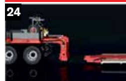
24 Hydraulisch verstelbare en afneembare Gooseneck