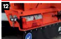
12 Volledig LED-achterlicht