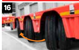
16 Hydraulische stuuras