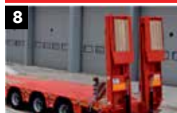
8 Verschillende soorten laadkleppen