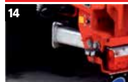
14 Achterste steunpoten