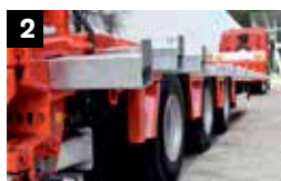
2 Zijdelingse Uitbreidingsbeugels