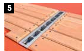
5 Verticale zuil Zakrijen