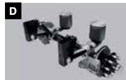
D BPW as