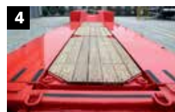
4 Afneembare hardhouten vloer