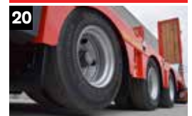
20 As heffen