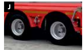
J Stalen velgen