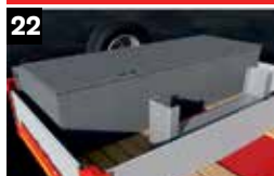
22 Uitbreiding hardhouten opbergbox