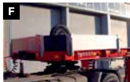
F Afgeschuinde Gooseneck type