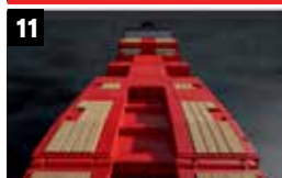
11 Graafarm uitsparing