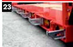
23 Zijdelingse uitbreidingsbeugels