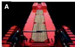
A Dubbele of centrale kokerbalk