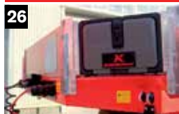
26 Gooseneck volledige toolbox